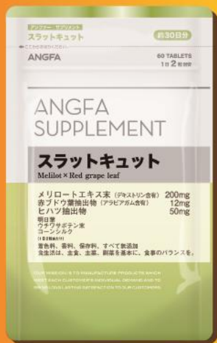
「スラットキュット」 1,080円(税抜)