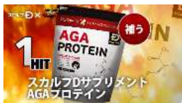
スカルプD サプリメント AGAプロテイン