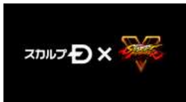
スカルプD × ストリートファイターV

動画にはお馴染みのキャラクターを始めとして、『ストリートファイターV』より初参戦の“魂屠る闇「ネカリ」”やストZEROシリーズより久々の参戦、“七色ボンバー「レインボー・ミカ」”、「ストリートファイターV HOT!パッケージ」同梱コスチュームを着た「春麗」「ベガ」などが登場。1コンボをアンファーの頭皮ケア商品に見立て、『内側から補い、頭皮を洗い・動かし・整え、とどめには髪を育てる』という“5HITコンボ”を見事に決めるという内容になっております。更に、最後には「リュウ」の必殺技“真空波動拳”が『波動ジェット』のように相手に噴射され、「リュウ」の「この道を進むのみ」というメッセージで締めくくられ、今までにない迫力のある動画となっております。