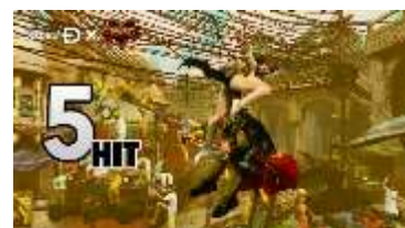
先行配信のコスチューム 春麗 × ベガ