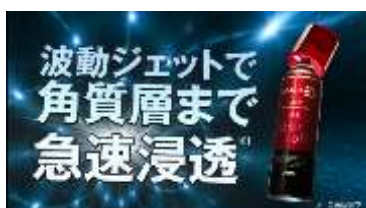
波動ジェットで 角質層まで急速浸透