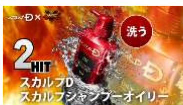
薬用スカルプDシャンプー