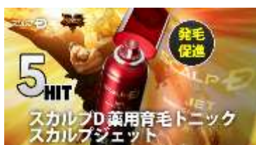
スカルプD スカルプジェット 薬用育毛トニック