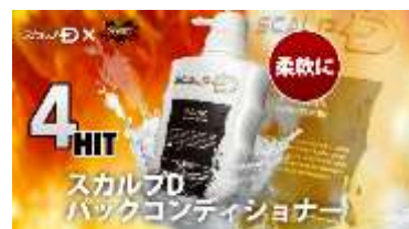
スカルプD バックコンディショナー