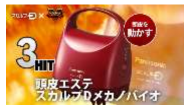
スカルプD 頭皮絵エステ スカルプD メカノバイオ