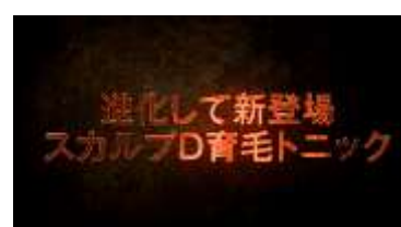
進化して新登場 スカルプD 育毛トニック