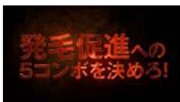
発毛促進への5コンボを決める!