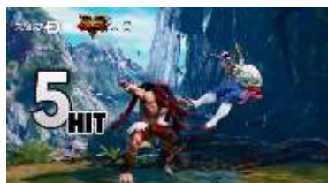
ネカリ × パルログ