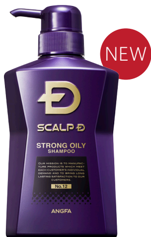
スカルプD 薬用スカルプシャンプー ストロングオイリー 〔超脂性肌用〕