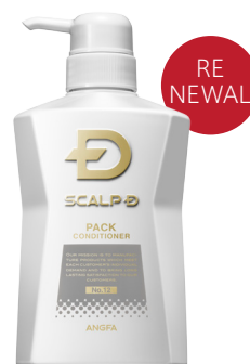
スカルプD 薬用スカルプパックコンディショナー