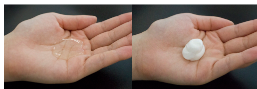
一般的なシャンプー