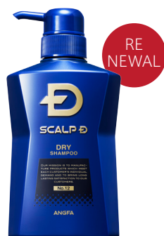
スカルプD 薬用スカルプシャンプー ドライ〔乾燥肌用〕