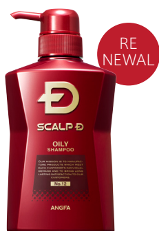
スカルプD 薬用スカルプシャンプー オイリー〔脂性肌用〕