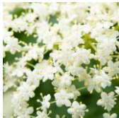
セイヨウニワトコエキス

頭皮ケア成分の開発を目指し、新規原料開発チームを発足しました。何百種類もある原料を精査し、セイヨウニワトコエキス ※12 とクロレアエキス ※13 からなる「スカルプポリューマー」を新配合。頭皮に浸透 ※14 し、「根付く頭皮」 ※6 に導きます。