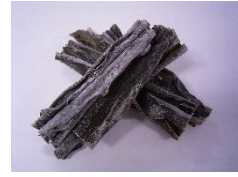
ミツイシコンブエキス ※4

「何気なくこすった瞬間…」といった経験はありませんか。今回のリニューアルでは、伸びたまつ毛をしっかりキープし、美しいまつ毛を維持してくれる「WIDELASH TM ※5」に加え「ミツイシコンブエキス ※4 」を新たに配合。プレミアムだけの「キープ成分 ※3 」が、まつ毛の土台をしっかり整え、より健康で抜け目ない ※1 まつ毛に導きます。