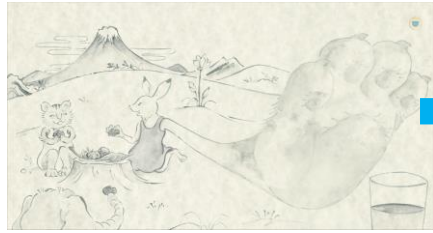
泥団子で遊ぶうさぎと汚れた手