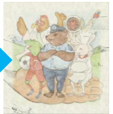
たくさんのミライを表現