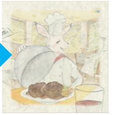
シェフになったミライ