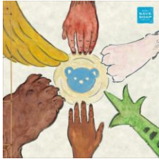
SAVE SOAP に集まる カエル・うさぎ・猿・鳥・熊・人の手