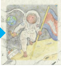
宇宙飛行士になったミライ