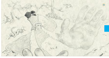
木登りをして遊ぶ猿と汚れた手