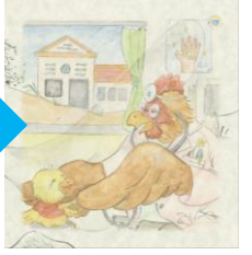
医者になったミライ