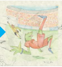
サッカー選手になったミライ