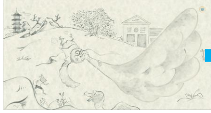
怪我をってしまった鳥と汚れた手