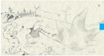
サッカーボールで遊ぶカエルと汚れた手