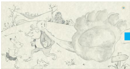
おんぶして遊んでもらっている熊と汚れた手