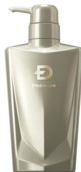
スカルプD プレミアム スカルプパックコンディショナー N

販売名:SDP コンディショナーCJ3 価格:4,900 円(税込) 容量:350mL [化粧品]