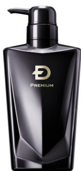
スカルプD プレミアム 薬用スカルプシャンプー オイリー N [脂性肌用]

販売名:SDP 薬用シャンプーCJ3R 価格:4,900 円(税込) 容量:350mL [医薬部外品]